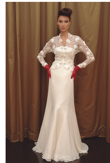
Una creazione di Lorenzo Riva

Tra le creazioni proposte, anche un preziosissimo abito da sposa ricamato con diamanti taglio Leo Cut